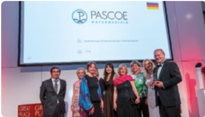
Das internationale Team gratuliert Pascoe zur Auszeichnung „Best Workplaces Europe 2015“

Gleich noch einen Preis durfte das Unternehmen Ende Juni in Essen entgegen nehmen. Dort wurde es auf dem