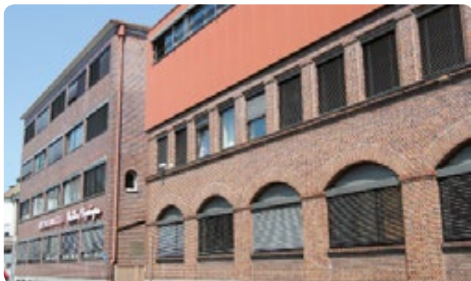
Zum Jahresende schließen Müller Göppingen und Staufen-Pharma ihre Pforten.